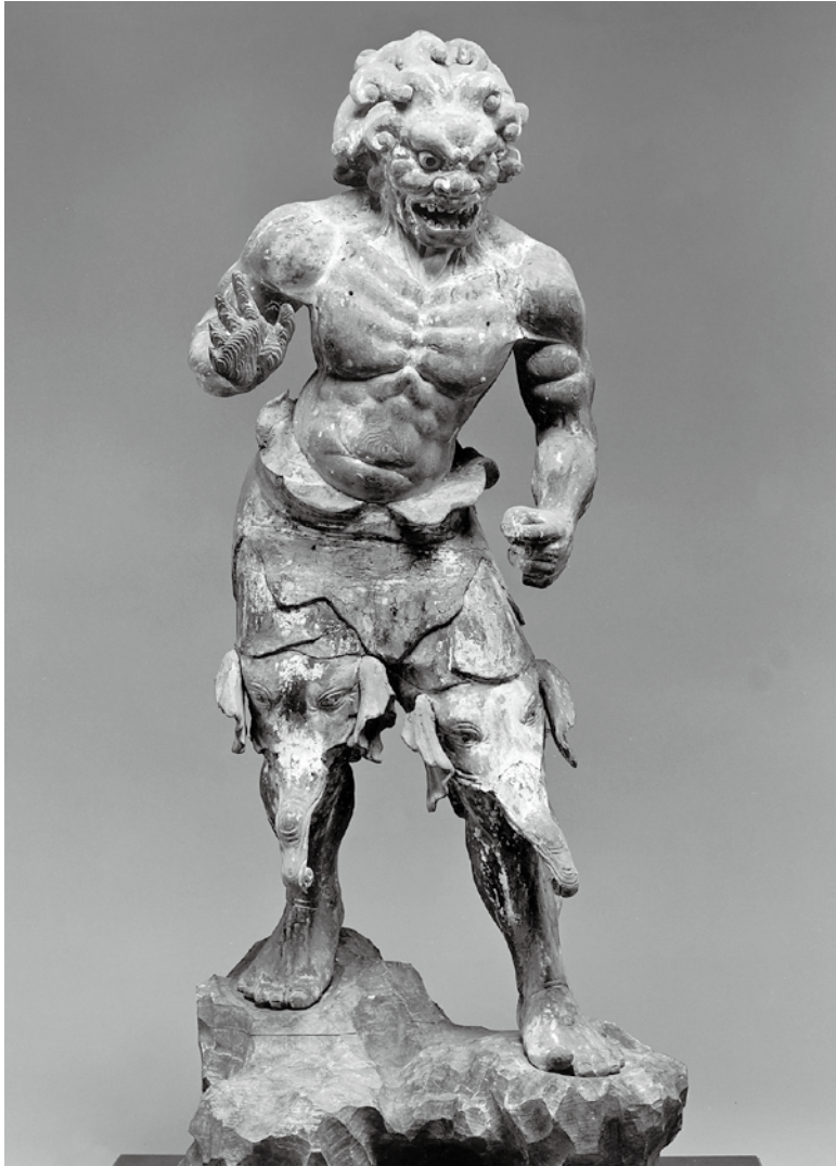
深沙大將像 京都 金