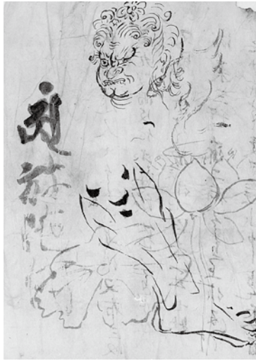
阿弥陀如来像納入品 八葉蓮華寺

彫刻史研究に新たな展望を開いた『日本彫刻史基礎資料集成平安時代篇』に続き、待望の『鎌倉時代 造像銘記篇』第1期刊行開始。鎌倉仏約370体の研究上必要な基礎データと多様な写真を掲載する、必携の資料集成。